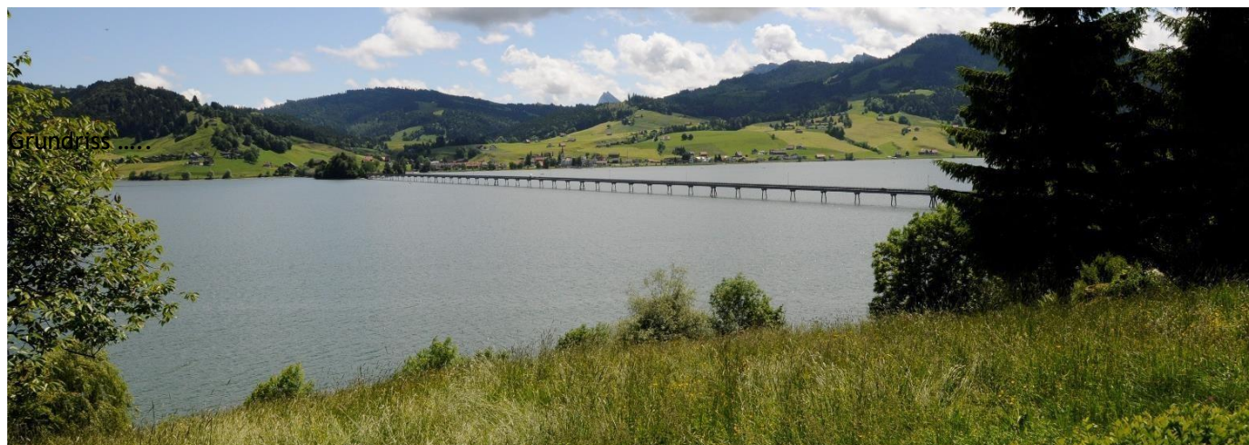
Ausblick auf den Sihlsee

Stellen Sie sich vor: Sie sitzen nach einem erlebnisreichen Tag im Loungesessel und entspannen, in der Hand ein Glas Wein und ein Lächeln auf den Lippen - schön, dass dieser Traum Wirklichkeit geworden ist.